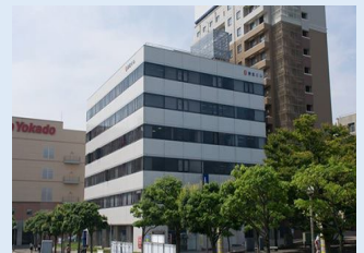
本社は、日立駅から徒歩 1 分

取引先：日立製作所グループ各社、JX金属、三菱パワーシステムズ NTT データ MHI システムズ、東鋳商事 他