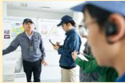
インターン社内見学の様子