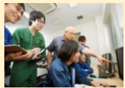
開発現場の見学の様子