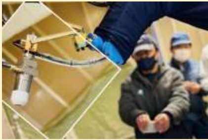
ノズル開発チームの様子